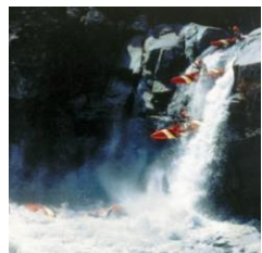
1985 Gründung der Firma „Kajak Sports Productions“

Eigentlich wollte Jochen Schweizer als einer der besten Extrem-Kajakfahrer der Welt mit Kajakfilmen berühmt werden. Sein Schicksal sah das anders und brachte ihn über einen zufälligen Bungeesprung als Stuntman zum Geschäft mit unvergesslichen Erlebnissen.