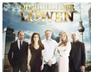
2017 Veräußerung der Digitalsparte der Jochen Schweizer Gruppe an die ProSiebenSat.1 Media SE