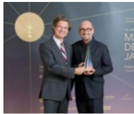
2012 Jochen Schweizer wird Marke des Jahrhunderts