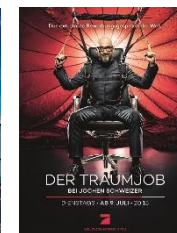
2019 Ausstrahlung „Der Traumjob – bei Jochen Schweizer“ in der Primetime auf ProSieben