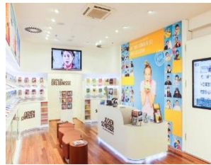
2005 Eröffnung des ersten Jochen Schweizer Erlebnis-Shops