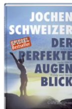
2015 Veröffentlichung „Der perfekte Augenblick“