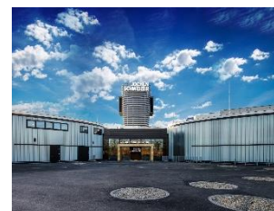
2017 Eröffnung Erlebnis-Destination „Jochen Schweizer Arena“ bei München